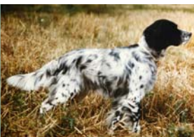
Nislaine de Roc Mignon Championne d'Europe