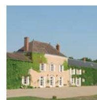
Le domaine de Saint Michel en Brenne. 31 ha de bois et de prairies dédiés à l'élevage, à l'éducation et à l'entraînement des chiens.